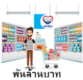
พันล้านบาท

ทั้งนี้ โฆษกกระทรวงการคลังขอขอบคุณหน่วยงานภาคีเครือข่ายของกระทรวงการคลังที่มีส่วนสำคัญในการอำนวยความสะดวกแก่ประชาชน ผู้ประกอบการร้านค้าและผู้ให้บริการที่เข้าร่วมโครงการเราชนะตลอดระยะเวลาที่ผ่านมา จนสามารถบรรลุวัตถุประสงค์ของโครงการได้